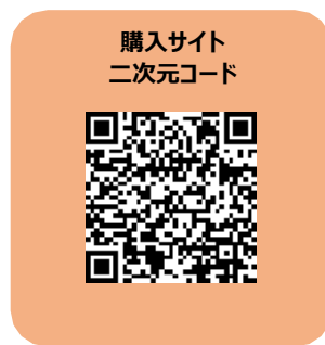
購入サイト 二次元コード

⚠ iPhoneのSMSメールは使用できません。Eメールでご登録ください。 @qq.comドメインのメールアドレスは弊社からのメールが届かないことが多いので、ご登録をお控えください。 旧字体の漢字はエラーになるため、 新字体 でご登録ください。